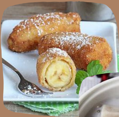
76. Chuối Chiên