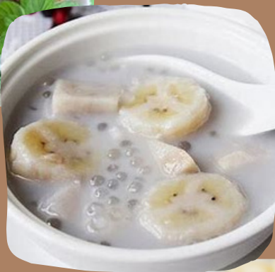
82. Chè Chuối Kokosmilchkompott mit Banane und Tapiokaperlen