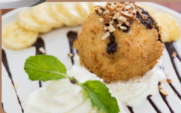
78. Kem Chiên gebackenes Eis mit Sahne